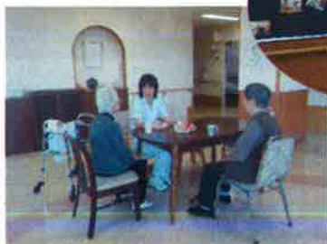
北アルプスが見える 談話室