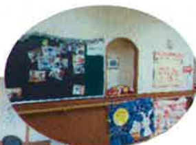
季節感あふれるロビー