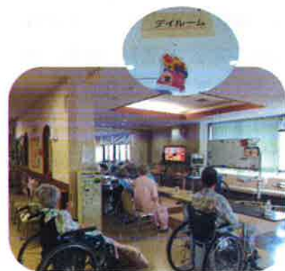
みんなで一緒に食事をします